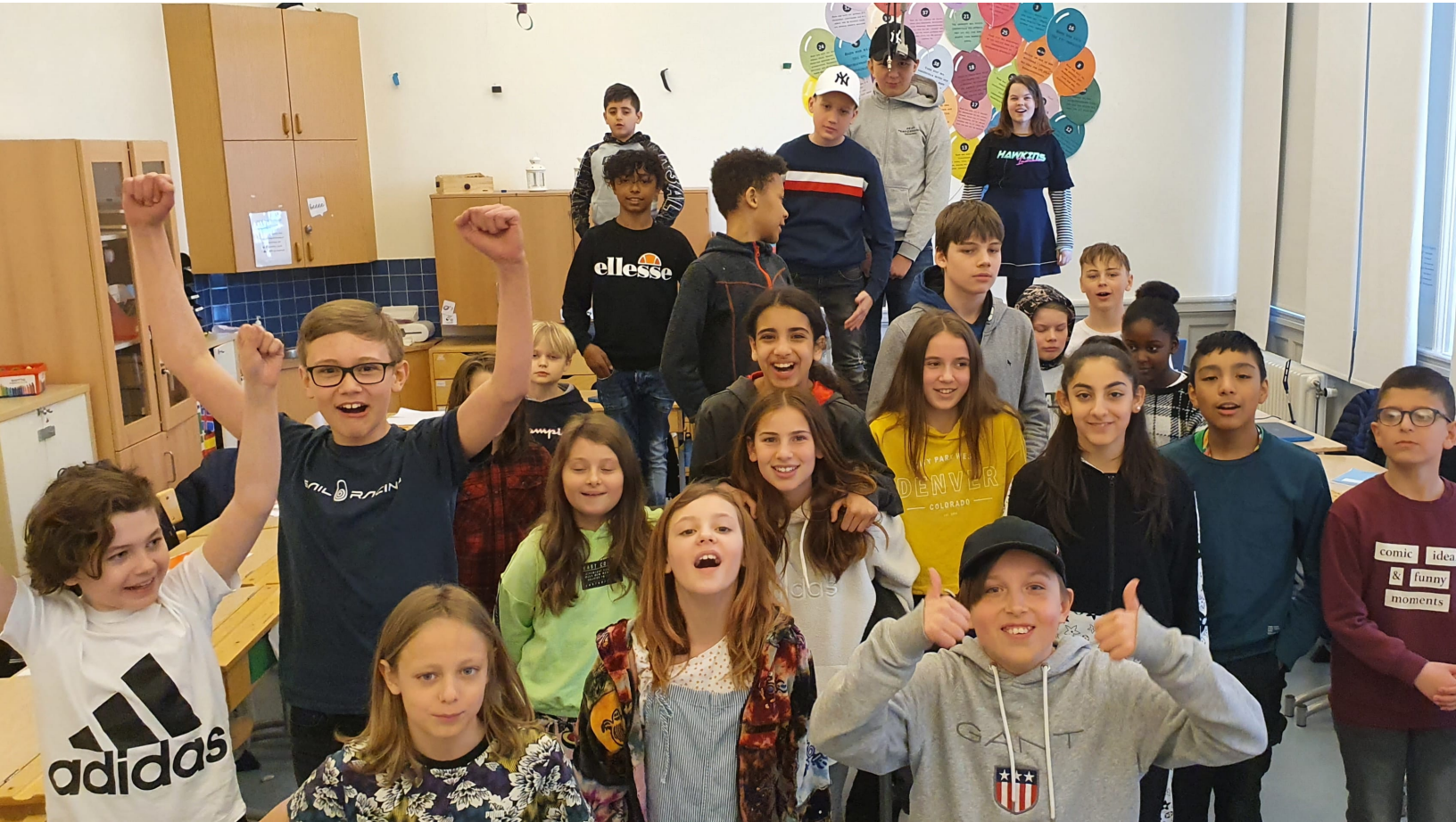
Klass 5 A Rörsjöskolan i Malmö, en av två klasser som vinner Årets skaffare 2021.