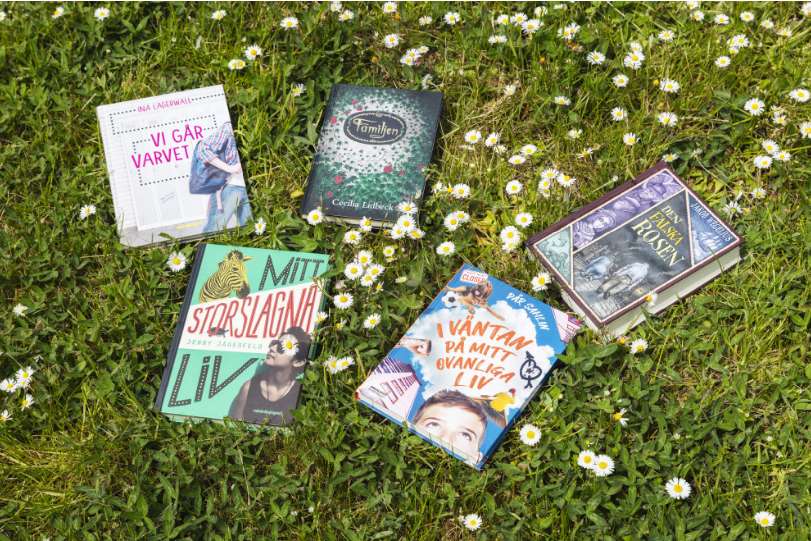
Barnradions bokpris, nominerade böcker 2020.